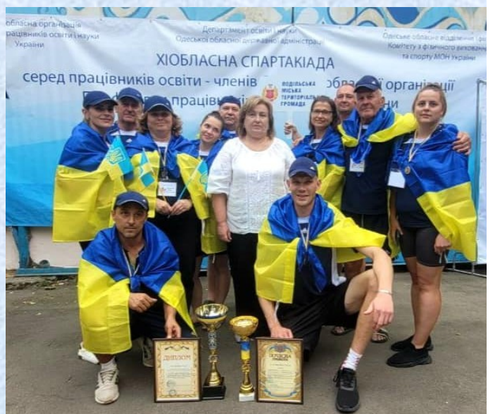
Команда Подільської міської організації Профспілки

III місце – Великомихайлівська об'єднана організація Профспілки.